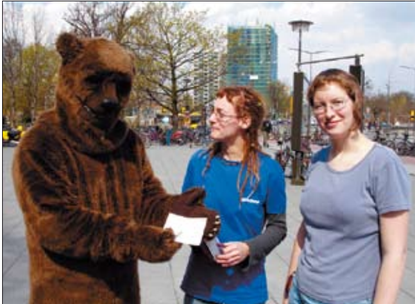
Die Greenpeace-Gruppe Dresden eröffnete am 19. April mit einer Auftaktveranstaltung vor dem TU-Hörsaalzentrum die Recyclingpapier-Aktionswochen unter dem Motto „Copy-Right!“

Die teilnehmenden Dresdner Copy-Shops: Copy-Shop an der Uni, Mommsenstraße, TU-Campus; Die Kopie, George-Bähr-Straße, TU-Campus; Copy Cabana, George-Bähr-Straße, TU-Campus; ZIMO Druck und Kopie, Mildred-Scheel-Straße, Blasewitz; Copyland, Bischofsweg, Dresden-Neustadt