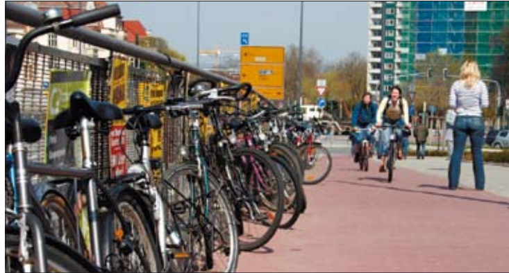
Chinesische Verhältnisse am TU-Campus: Zumindest im Sommer bietet das Fahrrad eine mobile Alternative zu vollen Bussen. Gäbe es das Semesterticket plötzlich nicht mehr, stünden hier wahrscheinlich noch mehr Drahtesel.