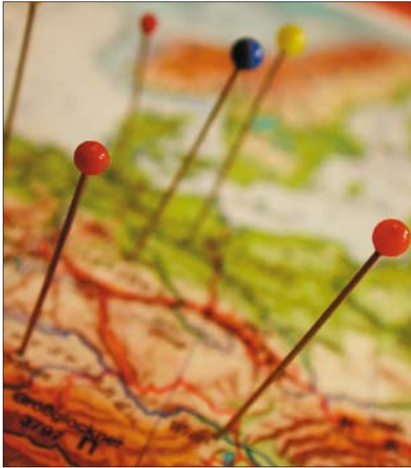
Grenzüberschreitende Karrieren für Nachwuchswissenschaftler sind kein Traum, wenn man gut informiert ist.

band für die Deutsche Wissenschaft und der Volkswagen-Stiftung präsentieren sich dort auch die Fraunhofer-Gesellschaft (FHG), die Helmholtz-Gemeinschaft (HGF), die Leibniz-Gemeinschaft (WGL) und die Max-Planck-Gesellschaft (MPG). Auch die Nachwuchswissenschaftlerförderung der Europäischen Kommission, das Marie Curie-Programm sowie die Förderung durch Begabtenförderwerke werden vorgestellt. Gemeinsam mit dem Sächsischen Staatsministerium für Wissenschaft und Kunst und den Sächsischen Hochschulen wird die TU Dresden diese Veranstaltung am 26. April 2006 als Gastgeber durchführen.